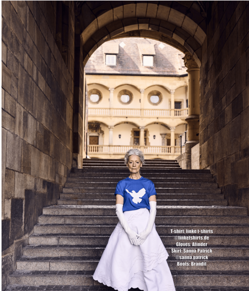
T-shirt: linke t-shirts @linketshirts.de Gloves: Afinder Skirt: Sanna Patrick @sanna.patrick Boots: Brandit