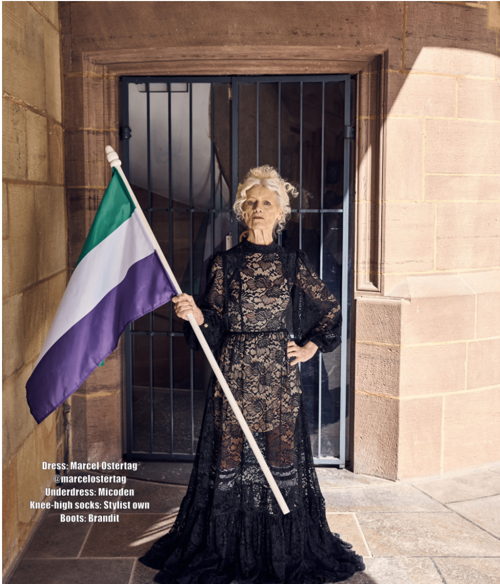
Dress: Marcel Ostertag @marcelostertag Underdress: Micoden Knee-high socks: Stylist own Boots: Brandit