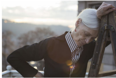
LINKS LEDERUCKE, GEDRUCKTES LEINWAND, HORN, MANTEL HORN, WÄNDERTAFEL, MANGON SCHUHE: HOKU WANGCHERA | MARBELL