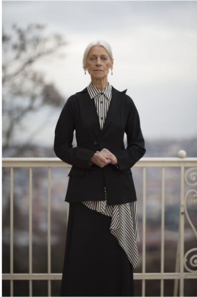
Full Outfit: HERRI WANSCHERA | YOHJI YAMAMOTO